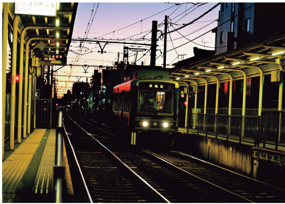
▲羽田久直「冬の夜明カ」