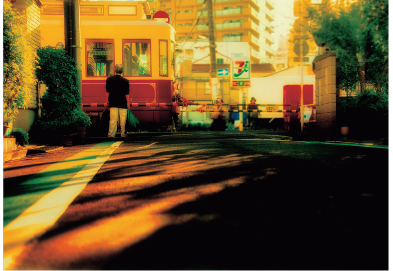
▲高村豊明「夕暮れを運ぶ電車」