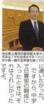
東京都立聖学院大学で、本の資料を生かした施設で、天井は、アクリル板を天井にデザインされている。柱は、木製、床は、滑り止めの素材を用いたフローリングが採用されている。

「地元が好きでしたからね。本当は荒川区の学校に通いたかった。ですから、中学で日暮田の国成に入ったときは、それはうれしかったです。」