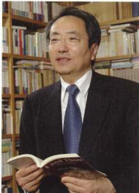
学長室の書架にはスピリットのこもった蔵書が並び、授業に携ったのは書物の外に留まらず、朝日新聞の記者で読者の心をつかむための本と「マガジンプラザ」を運営。

開成は進学校の印象を持たれる向きが多いけれど、異色心が強い、そんな雰囲気、いい学校でした。