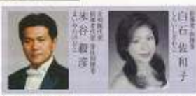
ほっとチーム 東京荒川少年少女合唱隊 http://www.arakawa-bgc.com/