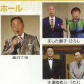
あした順子・ひろし

昼の部:午後1時開演(午後0時30分開場) 夜の部:午後5時開演(午後4時30分開場) 入場料=前売2,000円 当日3,000円 ※70歳以上は半額(年齢の証明ができるものをお持ちください) 【全席自由】