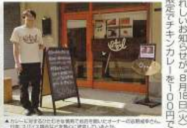
▲カレーに合う飲み物も豊富なお酒に合わせたメニューも用意されています。カレー+おつまみ+ビール、なんて夏らしい晩酌もオツなものですね。

サービスチケット お食事をご注文のお客様に ソフトドリンク無料 8月31日(月)まで有効です(13時-18時) ※予約不要