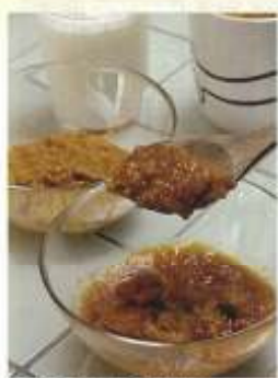
▲鶏肉と野菜を炒めこんでルーと一緒に絡め、でも油分は抑えられている。

そして安いだけでなく、もちろん抜群に美味しい。スパイスボウルでは「日常食としてのカレー」にこだわっていて、塩分と油分を抑え、素材とスパイスの風味をより味わえるように調理しています。でも、物足りなさなるまでたっぷりナン。手前振掛けて肉、野菜を下処理して、じっくりと煮込んだトロトロのルーは、ひと口食べた瞬間から、野菜の甘味とコク、スパイスの風味が口いっぱいに広がります。たとえばチキンカレーの鶏肉は、とって美味しく