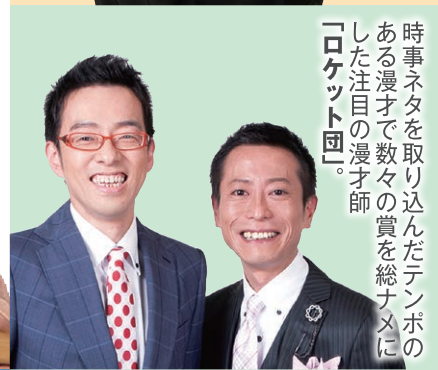
時事ネタを取り込んだテンポの ある漫才で数々の賞を総ナメに した注目の漫才師 「ロケット団」。