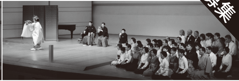
【写真】昨年度の本番公演の「能楽謡隊」「オペラ合唱隊」の様子